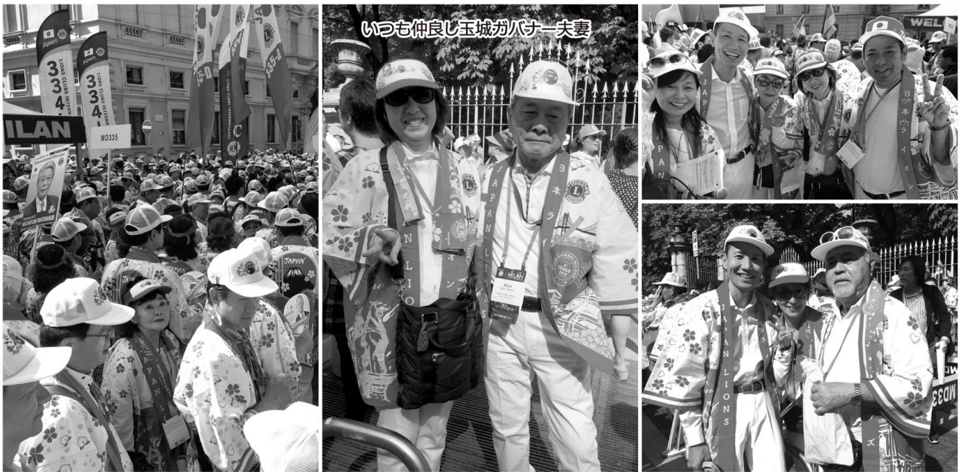
第102回ミラノ国際大会 2019.7.5~7.9