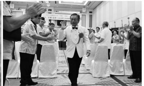
沖縄R1Zガバナー公式訪問 2019.8.5 (月)